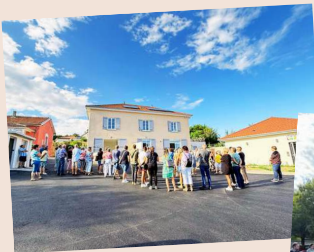
Visite guidée de l'opération "Bellevue" par les habitants le 24 juillet 2026