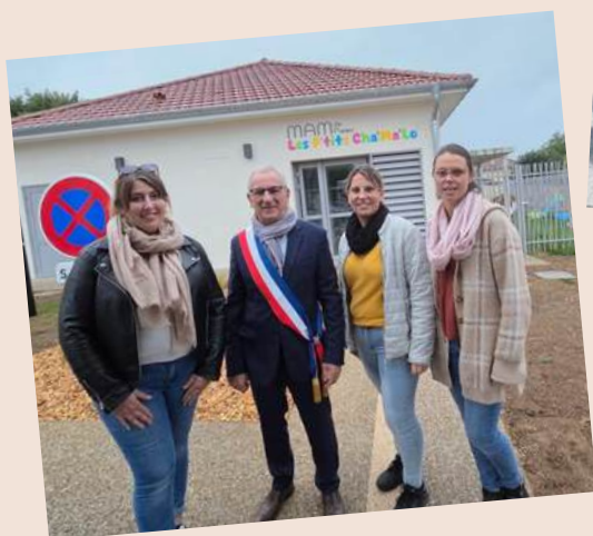
Inauguration officielle de la Maison des Assistantes Maternelles et des logements de l'opération "Bellevue" le 9 octobre 2026