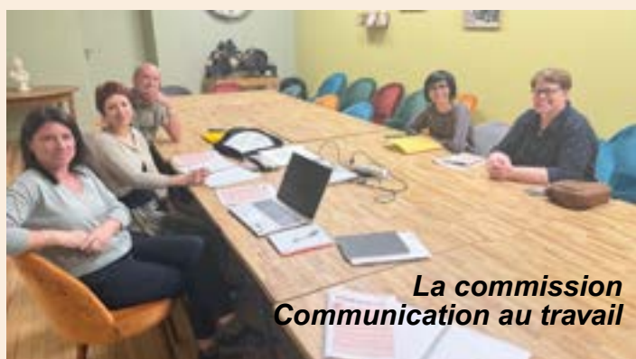
La commission Communication au travail