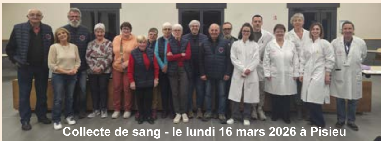
Collecte de sang - le lundi 16 mars 2026 à Pisieu