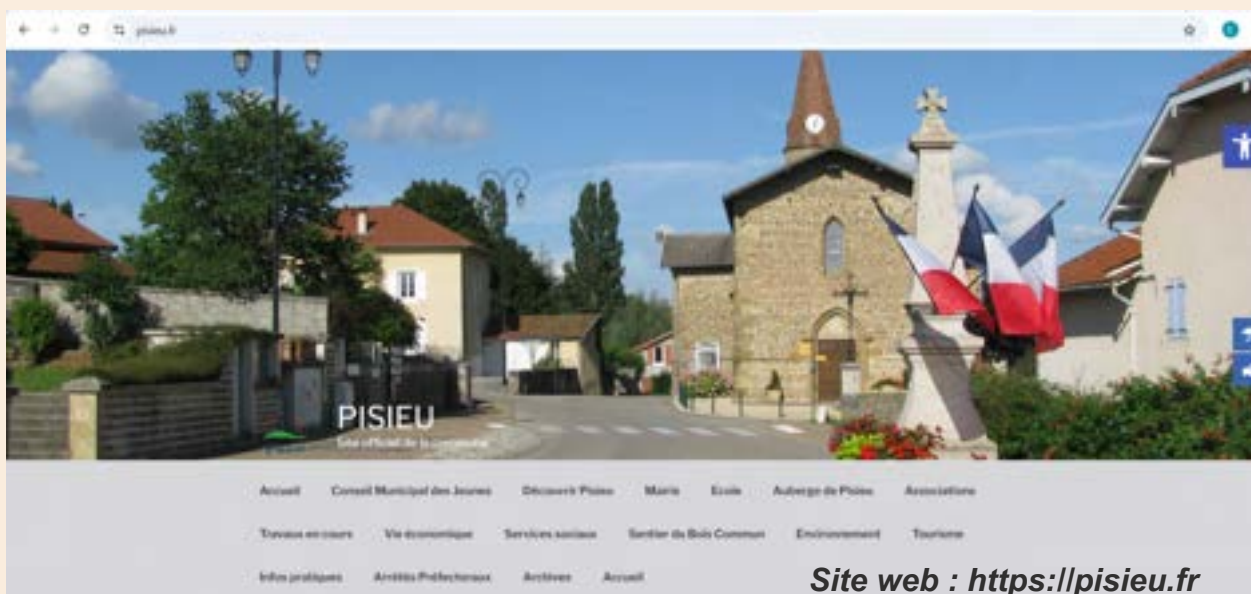
Site web : https://pisieu.fr

La gestion de cette base de données respecte les principes du RGPD.