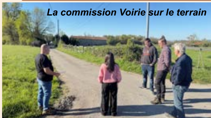
La commission Voirie sur le terrain