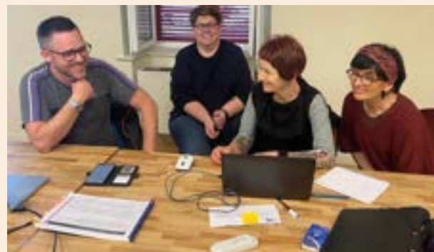
La commission Communication : refonte et réactualisation du site Internet de la commune