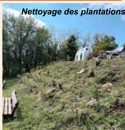
Nettoyage des plantations