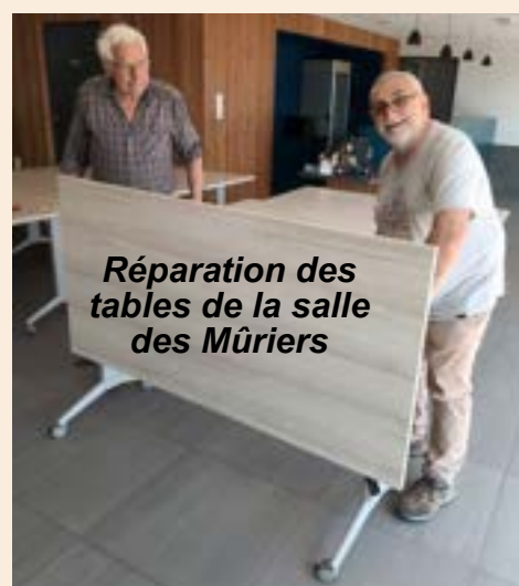
Réparation des tables de la salle des Mûriers