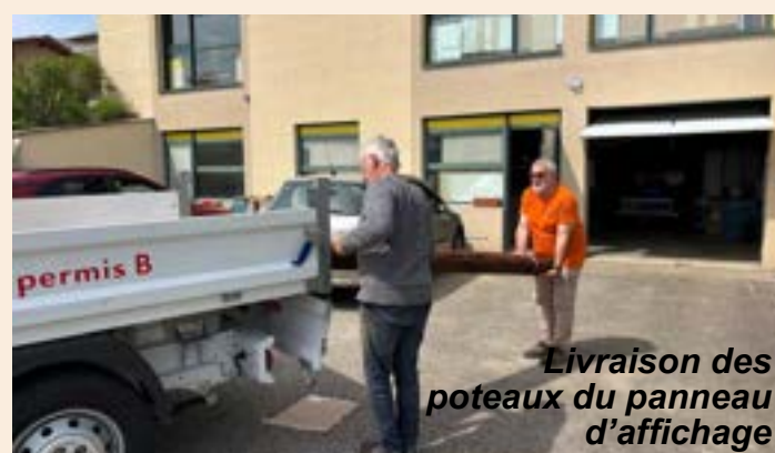
Livraison des poteaux du panneau d'affichage