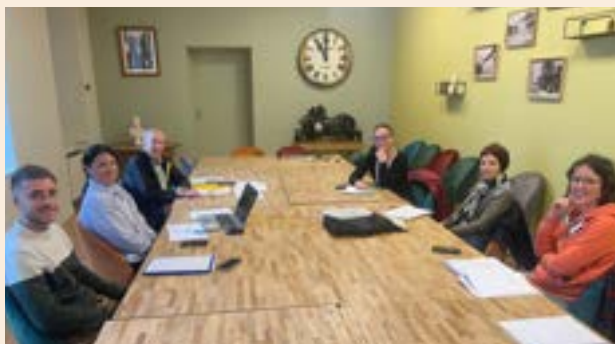
La commission Environnement & cadre de vie : plantations, espaces verts, signalétique ... à l'ordre du jour