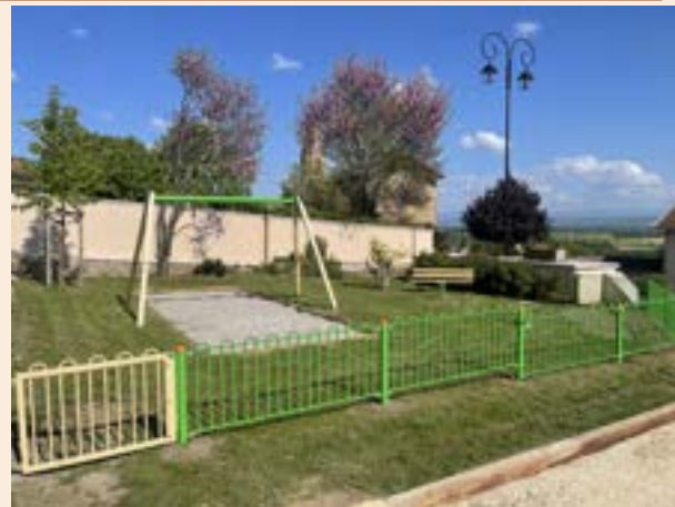
L'aire de jeux de Bellevue en voie de finalisation